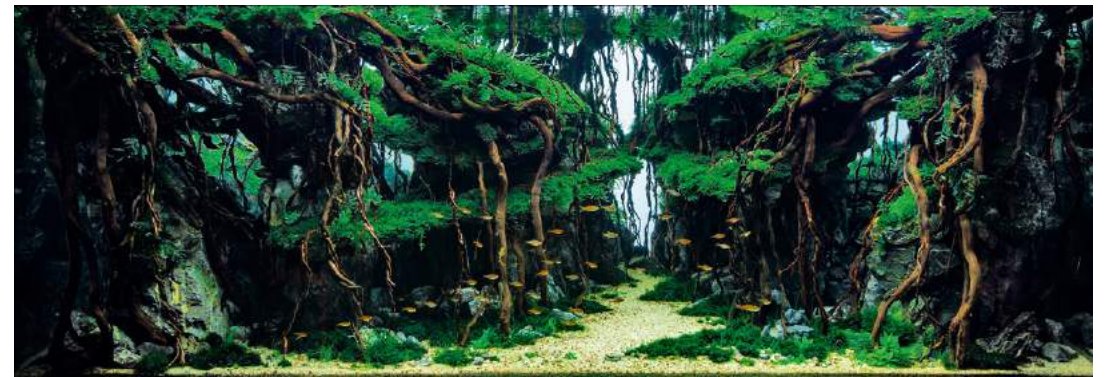
Aquarium Size W150×D60×H55 (cm)

水草：ニューラージ・パールグラス / ショート・ヘアグラス / エレオカリス・ビビバラ / ウィローモス / ボルビティス・ヒュデロツティ / ボルビティスsp. / ベビーリーフ / スタウロギネ・レベンス / ウォーターフェザー / ホウオウゴケsp. / スパイクモス / ナミガタスジゴケ / 南米ウィローモス 魚種：オレンジグッター・ダニオ / レッド・テトラ / オトシンクルス / ヤマトヌマエビ