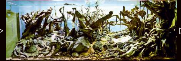
流木の枝先にツタを付けていきました。

ます。4人それぞれまったく異なる場所に所在しているので（マレーシアとシンガポール）、なかなか会うことはできませんが、談義やアクアリウムに関連した活動のため年に1、2回は顔を合わせます。できるときには、流木や石を集めに外で会うこともあります。普段はワッツアップのグループチャットで水草レイアウトなどについて会話をしています。2010年からともに活動をしています。