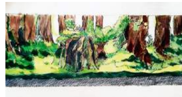
最初のアアイデアスケッチ。

最大の魅力はレイアウト制作です。自分の手で合理的に流木や石、水草を配置し、自然のあらゆる景観を表現することです。アイデアはすべて、自然の中にあります。生命力が芸術を生み、自然を親しいものに感じさせてくれます。