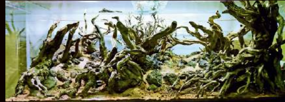
基本となる構図を組んだときの様子。

Little Green Cornerという、会員が4人だけの小さな水草レイアウトクラブに所属してい