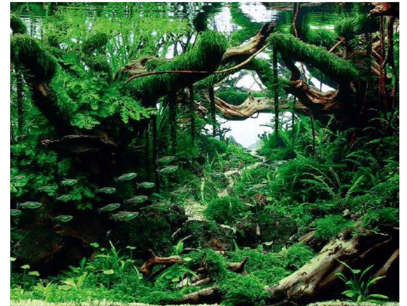
この作品の見どころとなるポイント。自然感と奥行き感の演出がうまくいきました。