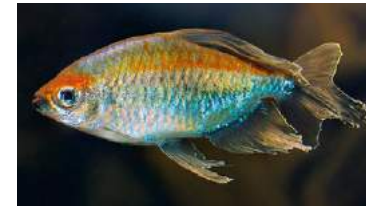
今回の作品の主役はコンゴ・テトラしか考えられませんでした。

IAPLCは世界で唯一の名誉ある水草レイアウトコンテストであるだけでなく、世界中の水草レイアウトの文化、ひいては一つの宗教とも言えるものです。多くの水草レイアウトが、年々無限に腕を上げるための重要な原動力だと思っています。