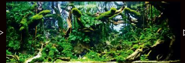
当初のイメージ通りにコンゴの森ができてきました。