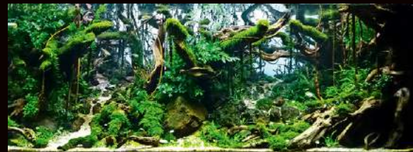
水草と流木のバランスも適度になってきました。