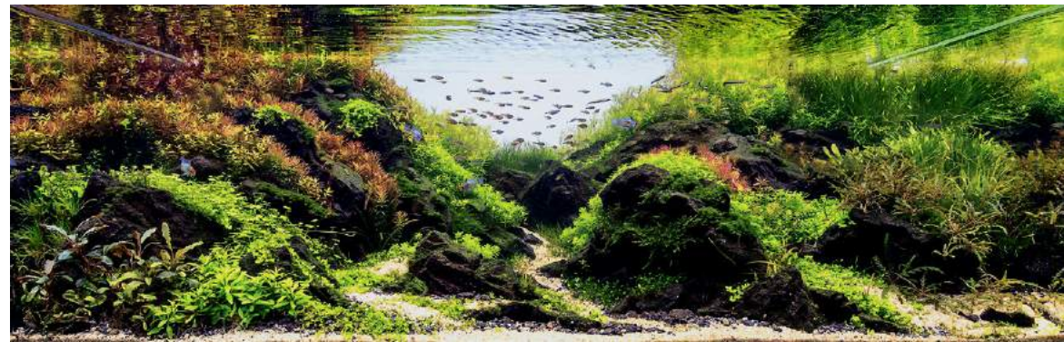
Aquarium Size W120×D60×H45 (cm)

水草：ロータラsp. Hra / ロタラ・インディカ / ロタラ・ロトンジフォリア / ロタラ・マクランドラ (グリーン) / ロタラ・ワリッキー / ロタラ・ナンセアン / ベトナムゴマノハグサ / ヤナギスズバ / ミリオフィラムの一種 / ミリオフィラムの一種 / オーストラリアン・ドワーフヒドロコチレ / ハイグロフィラ・ピンナティフィダ / エレオカリス・ミニマ / 南米ミスハコベ / ニューラージ・パールグラス / キューバ・パールグラス / プセファランドラの一種 / ベンソルム・セドイテス / エキノドルス・テネルス / ヨーロピアン・クローバー / ジャワモス / ウォーターフェザー 魚種：ミクログオファergus・ラミレシイ / フレーム・テトラ / テトラ・オーロ / ファイヤータール・ホタルテトラ / オリジナス・ウオウオラエ / ベンシル・フィッシュ