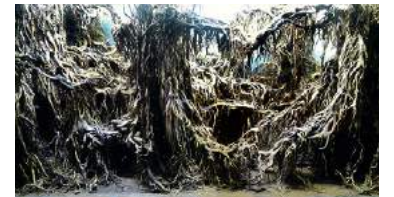
構図を組んだ状態の様子。

世界水草レイアウトコンテストは、毎年、アクアスケーパーに水景デザインへの発想力や創造力をもたらしてくれます。今後のIAPLCでは、より多くのアクアスケーパーが水景デザインのアイデアを持って参加することを願っています。