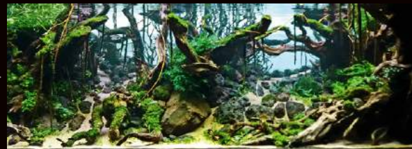
苔、シダが青々と生長し始めました。