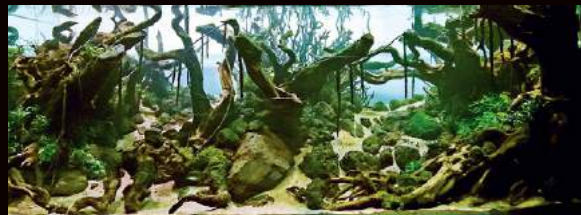
水草の植栽直後の様子。