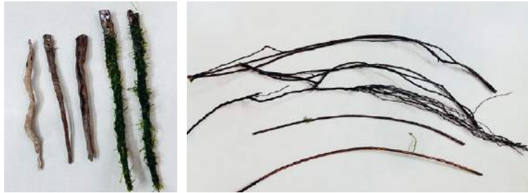
採集したツタの数々。丁寧にモスを巻きつけたりして使用しました。

人々の記憶に残るレイアウトを制作し、 長い間話題となるような「自分のスタイル」を築いていきたい。